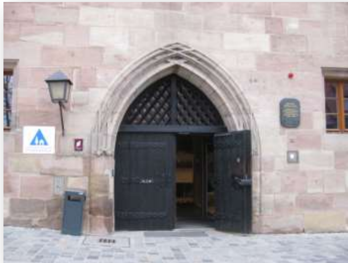
Eingangsbereich der Jugendherberge Nürnberg