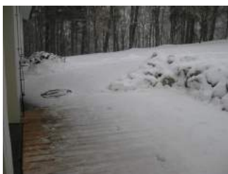
Weg von der Rezeption zum Ausseneingang Zimmerflur