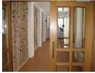
Flur mit Durchgang zur Rezeption