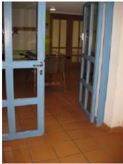
Flurtür und Saaltür