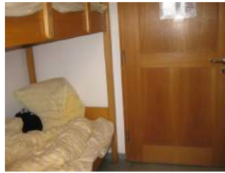
Zimmertür von innen