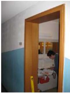
Zimmertür von aussen