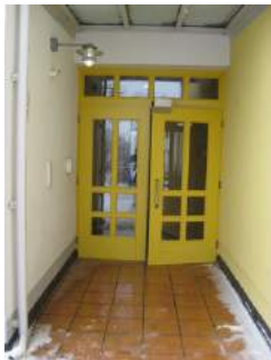
Eingangstür von aussen