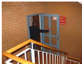
Flurtür zum WC