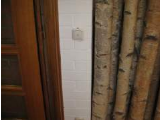
Wand auf Weg zur Rezeption