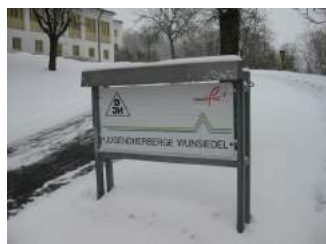
Schild DJH Wunsiedel