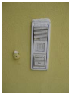
Klingel und Codeeingabe für Eingang oben für Rollstuhlfahrer