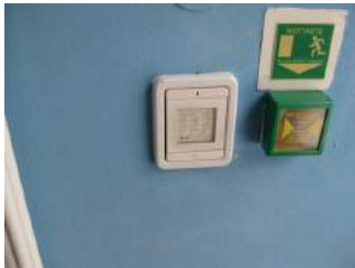
Codeeingabe innen zur Türöffnung