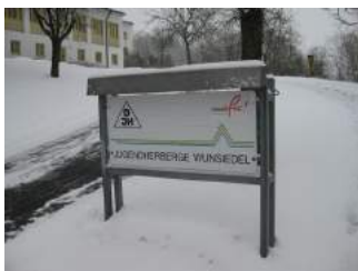
Schild DJH Wunsiedel