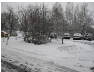
Weg vom Parkplatz zum Haupteingang