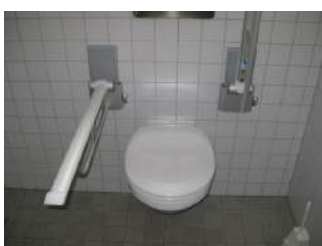
Haltegriff klappbar und höhenverstellbar