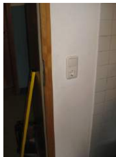
Eingang Sanitärbereich oben