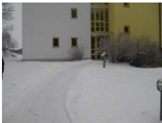
Weg zum Haupteingang