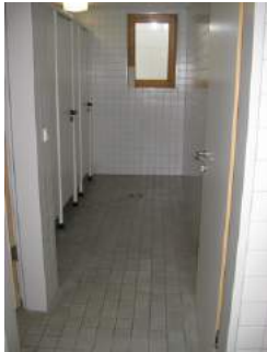
2. Tür im Vorraum öffentliches WC Damen und Herren