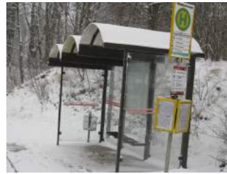
Häuschen an der Bushaltestelle

Entfernung der Haltestelle zum Eingang: 400 m