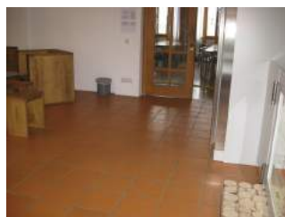
Weg zum Speisesaal