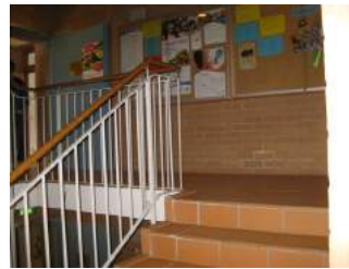
Weg vom Haupteingang zum WC