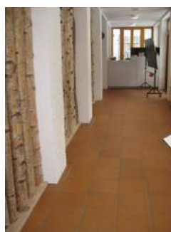
Weg zur Rezeption

Bewegungsfläche vor der Rezeption / Kasse - Breite: 200 cm