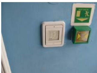
Codeeingabe zur Türöffnung von innen möglich