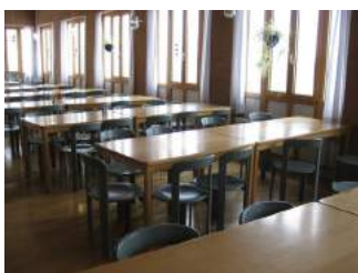
Speisesaal mit Bestuhlung