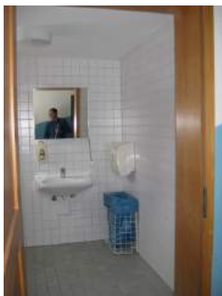
Tür Sanitärbereich oben