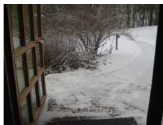
Sicht vom Eingang auf den Weg von der Rezeption