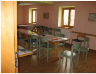
Tagungsraum 3 und 4