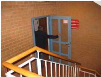
Flur und Treppenhaus

Haupteingang zum WC und Tagungsräumen 3,4 und Disco