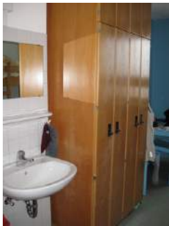
Zimmer mit Schränken