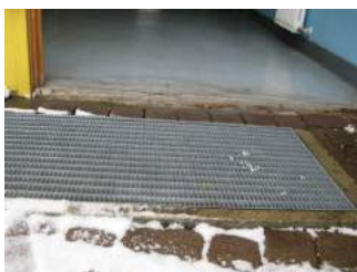
Fläche vor Eingang Zimmerflur für Rollstuhlfahrer