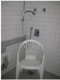
Fester und mobiler Stuhl