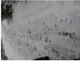
Weg zum Eingang