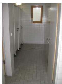
Türen im WC Bereich im UG