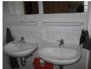
Waschbecken im Zimmer