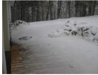
Weg zum Eingang