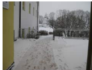
Weg zum Haupteingang