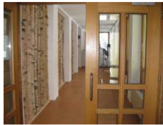
Weg zur Rezeption