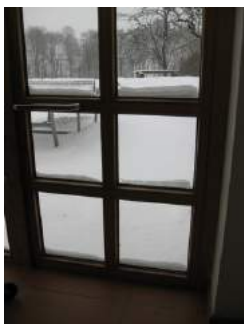
Eingangsbereich 3 unten