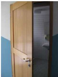
Sanitärtür ohne Beschriftung