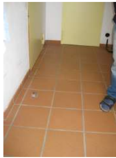
Bereich hinter der Tür