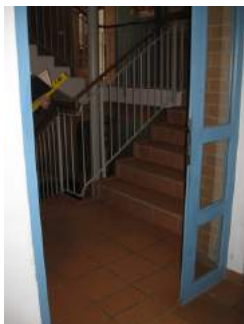
Flurtür zum WC