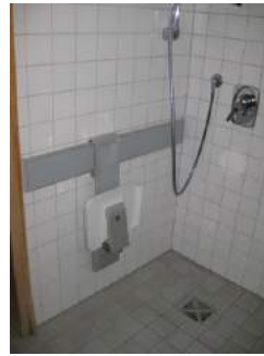
Fester Stuhl klapp- und verschiebbar