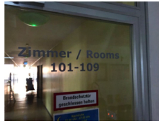
Beschriftung Weg zu den Zimmern