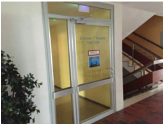
Beschriftung Weg zu den Zimmern