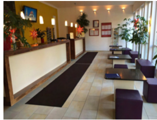
Rezeption mit Loungebereich