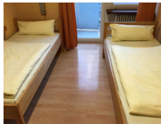
Betten und Bewegungsfläche