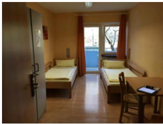
Zimmer Nr. 101