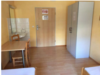
Zimmer Nr. 102