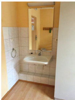
Waschbecken Zimmer Nr. 101