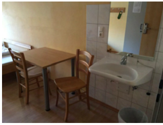
Waschbecken und Tisch