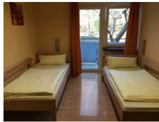
Zimmer Nr. 101