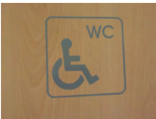
Beschriftung Toilette und Sanitärraum