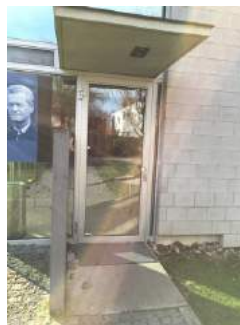
Eingang Pavillon - Nikolaus Lehner