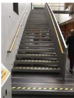
Treppe Eingangshalle - OG (Zimmer + Seminarräume