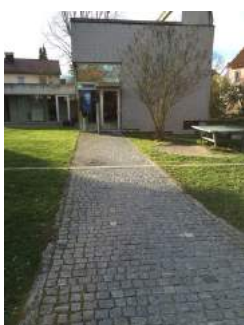
Weg zum Tagungsraum Pavillon - Nikolaus Lehner über Hinterausgang