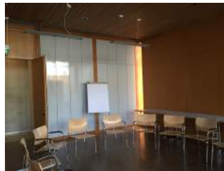
Tagungsraum Walter Klingenbeck