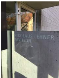
Eingang Pavillon - Nikolaus Lehner