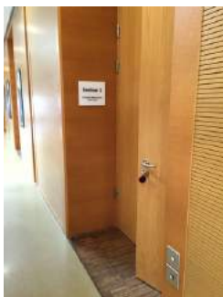
Eingang Tagungsraum Elisabeth-Block