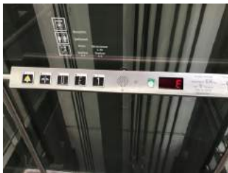
Aufzug - Bedienelement