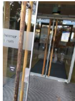
Windfang mit beiden Eingangstüren

Eingangsbereich visuell kontrastreich zur Umgebung abgesetzt.