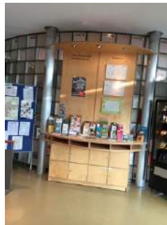
Infostand Jugendherberge Dachau