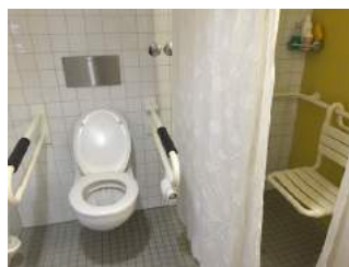
Toilette mit Dusche Zimmer 11