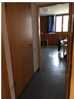
Eingang Zimmer 10