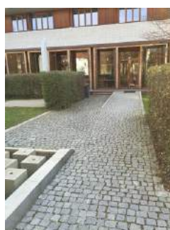
Weg zum Tagungsraum Pavillon - Nikolaus Lehner über Hinterausgang