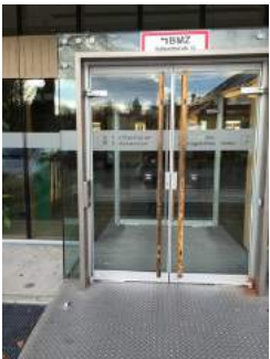
Eingangstür Jugendherberge Dachau