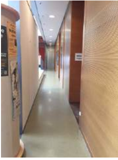
Flur zu den Seminarräumen EG