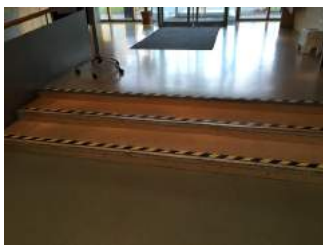
Treppe von Rezeption in Eingangshalle