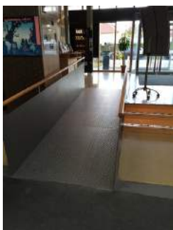
Rampe von Rezeption in große Eingangshalle