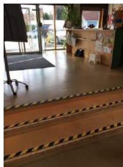
Treppe von Rezeption in Eingangshalle