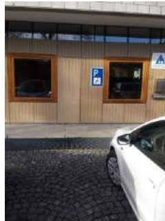
Parkplatz für Menschen mit Behinderung