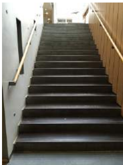
Treppe ins UG zur öffentlichen Toilette