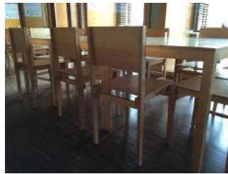
Tische + Stühle