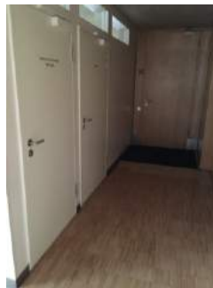
Flur OG zum Tagungsraum 5