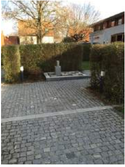
Weg zum Tagungsraum Pavillon - Nikolaus Lehner über Hinterausgang