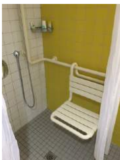
Dusche + Duschstuhl Sanitärraum Zimmer 10