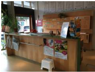
Rezeption Jugendherberge Dachau