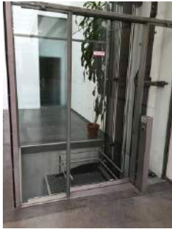
Aufzug - Türe