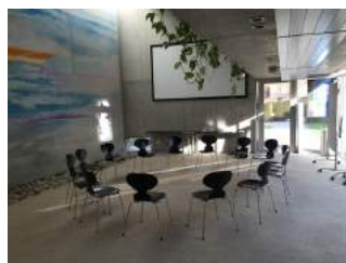
Tagungsraum Pavillon - Nikolaus Lehner