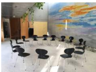
Tagungsraum Pavillon - Nikolaus Lehner