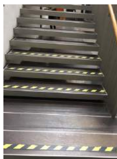
Treppe Eingangshalle - OG (Zimmer + Seminarräume