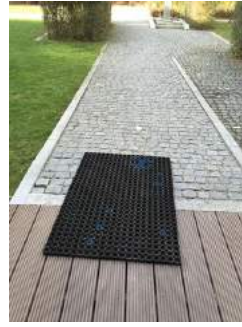
Weg zum Tagungsraum Pavillon - Nikolaus Lehner über Hinterausgang