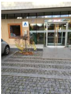
Weg zum Eingang