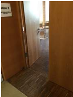
Eingang Tagungsraum Walter Klingenbeck