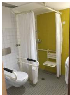
Toilette + Dusche Sanitärraum Zimmer 10