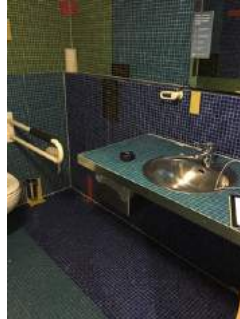
Öffentliche Toilette - Waschbecken