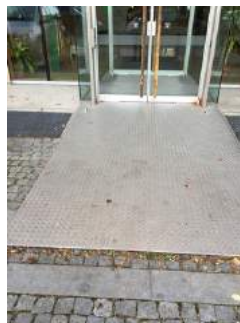
Weg zum Eingang