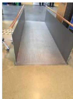
Rampe von Rezeption in große Eingangshalle