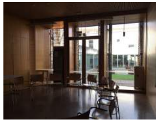
Tagungsraum Walter Klingenbeck