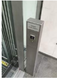
Aufzug - Schlüsselkasten (Schlüssel an der Rezeption erhältlich)