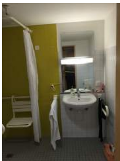
Waschbecken Sanitärraum Zimmer 10