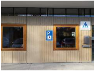
Parkplatz für Menschen mit Behinderung