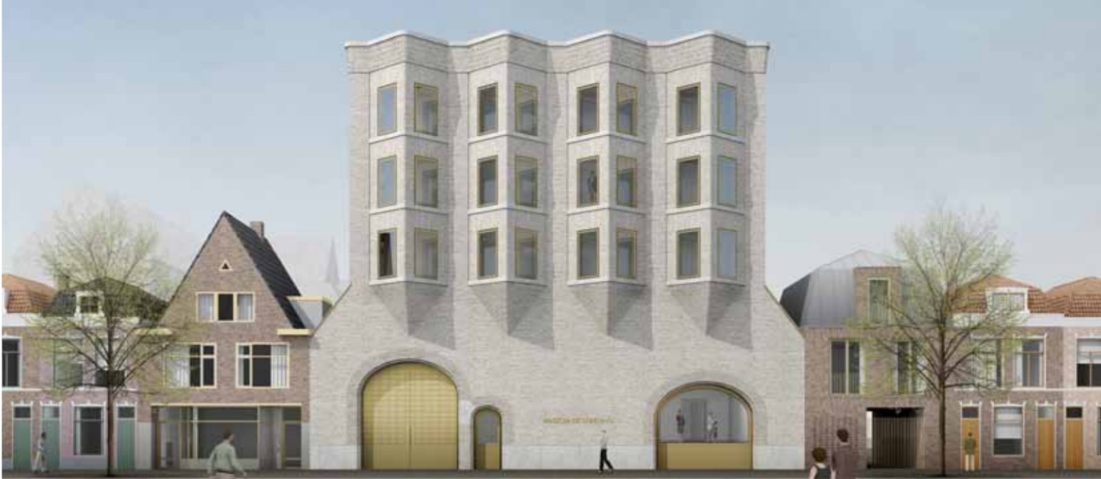
Impressie achtergevel Museum De Lakenhal

'Joriskamer'. De trap blijft de eerste met de tweede verdieping verbinden en de twaalf gravenramen worden met elkaar verenigd in een panorama van natuurlijk daglicht. Het bestaande ensemble van de Joristrap wordt bij deze verplaatsing zo volledig mogelijk overgenomen. Op de begane grond van deze kamer bevindt zich de bar van het museumcafé. Vanuit het museumcafé is een volledig doorzicht op de Joristrap mogelijk. De trap en de gravenramen zullen een belangrijke sfeerdrager in deze ruimte zijn.