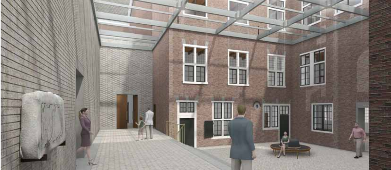
Visualisatie van de Achterplaats