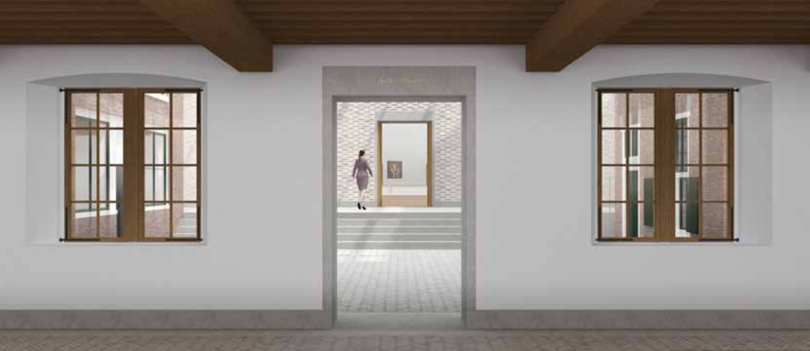
Visualisatie van de Entreehal

maar te respecteren uiterlijk. De gebouwen hebben een monumentaal postuur van veraf, maar zijn door de tektoniek, plastiek en ornamentiek ook van dichtbij interessant, waarbij de zorgvuldige detaillering van naden en voegen opvalt. Deze thematieken vormen het DNA waaraan de nieuwe interventie zich op eigentijdse wijze spiegelt en waarmee de nieuwbouw de bouwtraditie die het bestaande museumcomplex aanreikt, innoveert.