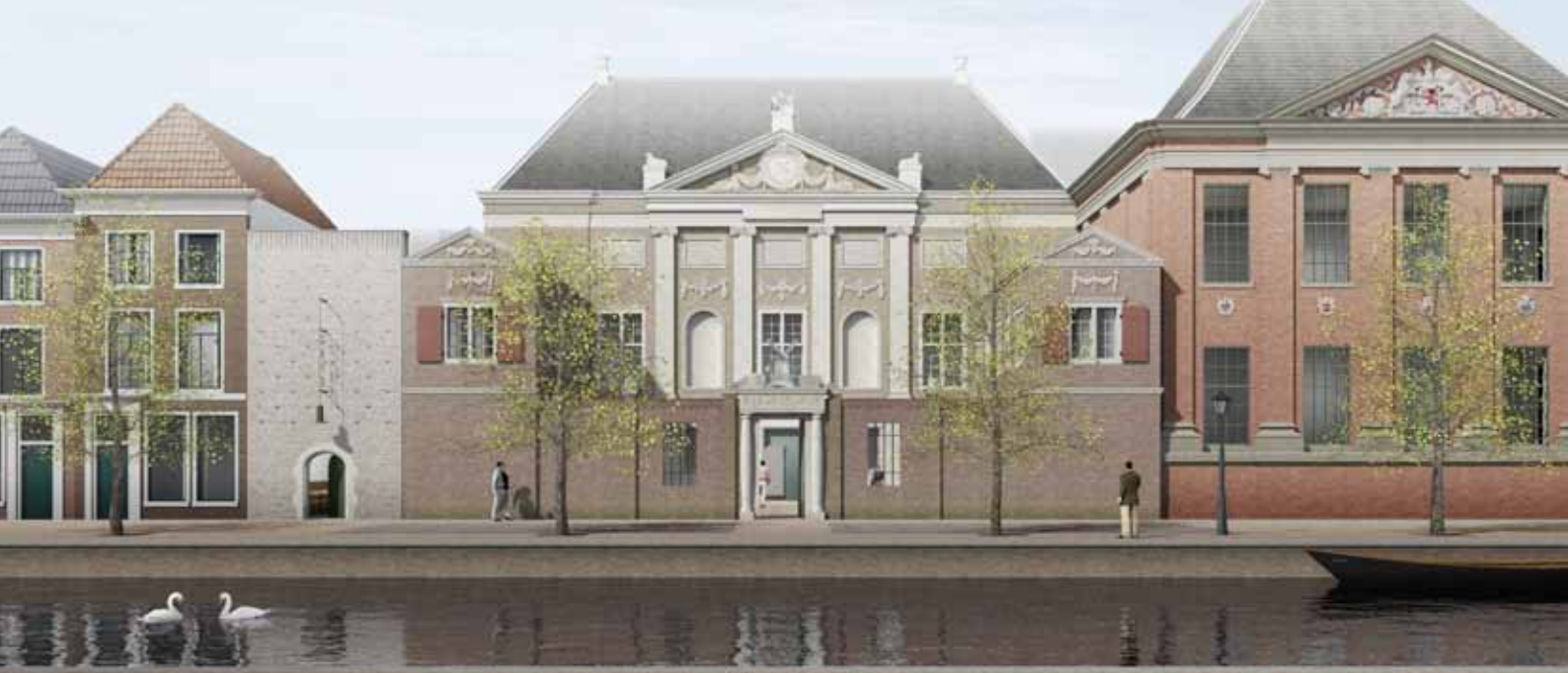
Visualisatie voorgevel Museum De Lakenhal