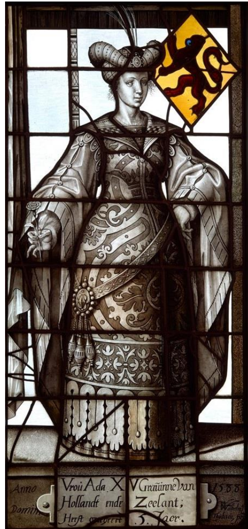
Gravenramen in Museum De Lakenhal.