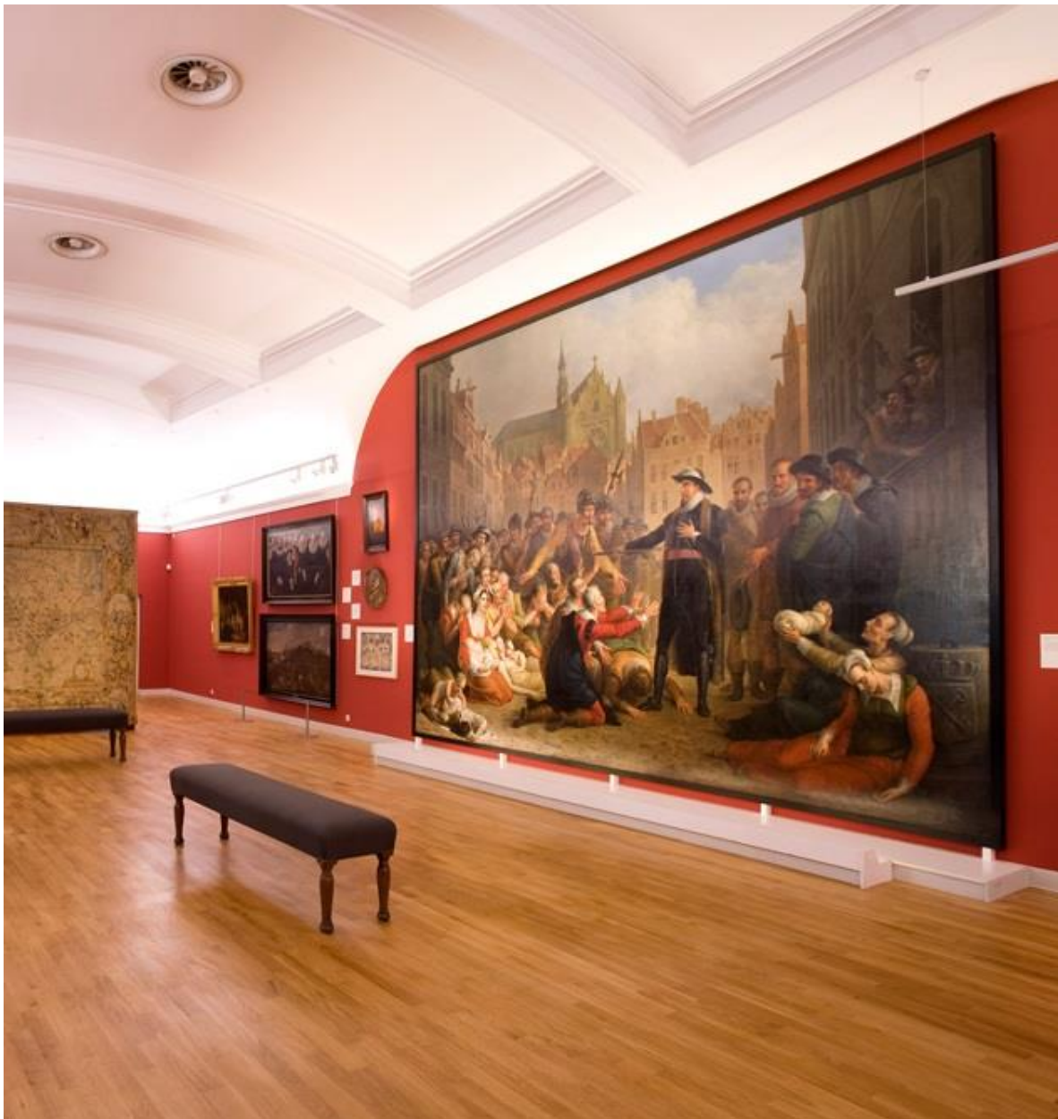
M.I. van Bree, De zelfopoffering van burgemeester van der Werf (1816-17). Collectie Museum De Lakenhal, Leiden.

Het nieuwe trappenhuis werd gebouwd op de centrale as van het gebouw en kwam uit in het midden van de paviljoenzaal. In een speciaal daarvoor aangebrachte koof was het monumentale schilderij 'De zelfopoffering van burgemeester Van der Werf' van Mattheus van Bree te zien. Het schilderij heeft decennialang op deze plaats gehangen, totdat het eind jaren zestig verhuisde naar de nieuwe hal in de Papevleugel. Bij de restauratie van de paviljoenzaal in 1994 werd het schilderij weer teruggeplaatst in de koof, waar het tegenwoordig nog altijd hangt. Wie de Joristrap bestijgt, komt oog in oog te staan met het schilderij. Deze historische mise-en-scène is waardevol en nog altijd effectief.