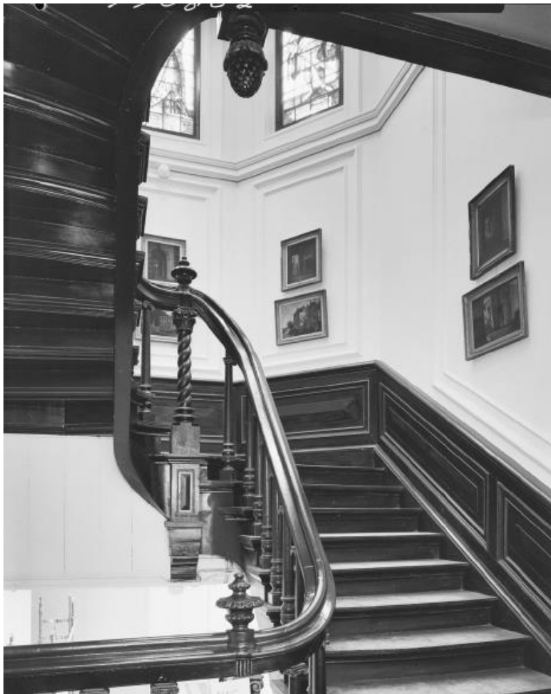
Historische afbeelding Joristrap in Museum De Lakenhal.

Deze argumentatie is besproken met medewerkers van Museum De Lakenhal, met de Gemeente Leiden als opdrachtgever van het project en met deskundigen van Erfgoed Leiden, de Rijksdienst voor Cultureel Erfgoed en de Welstands- en Monumentencommissie Leiden. Op basis daarvan is in goed onderling overleg het besluit genomen om de Joristrap te verplaatsen.