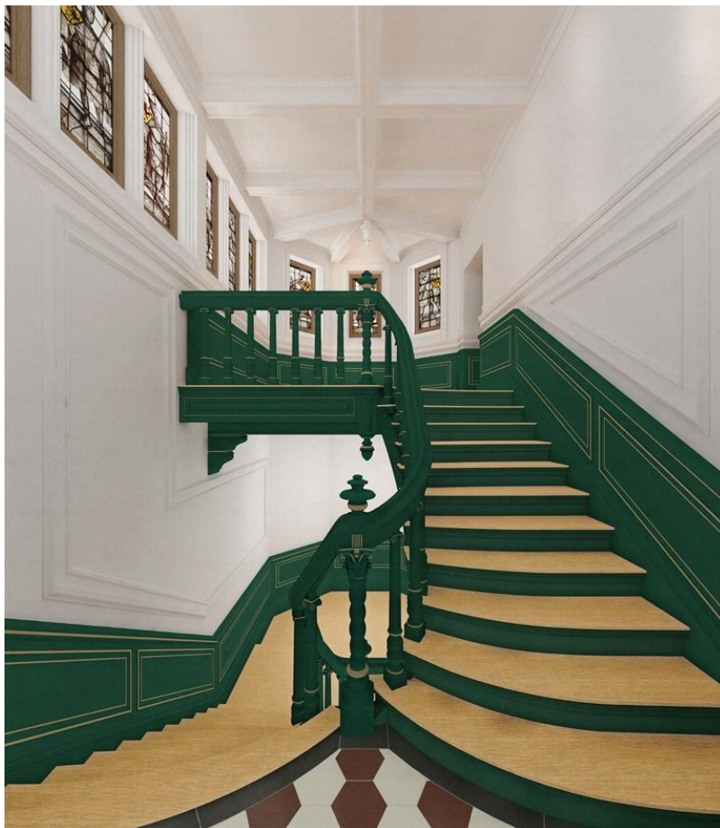
Impressieschets nieuwe situatie Joristrap in Museum De Lakenhal.