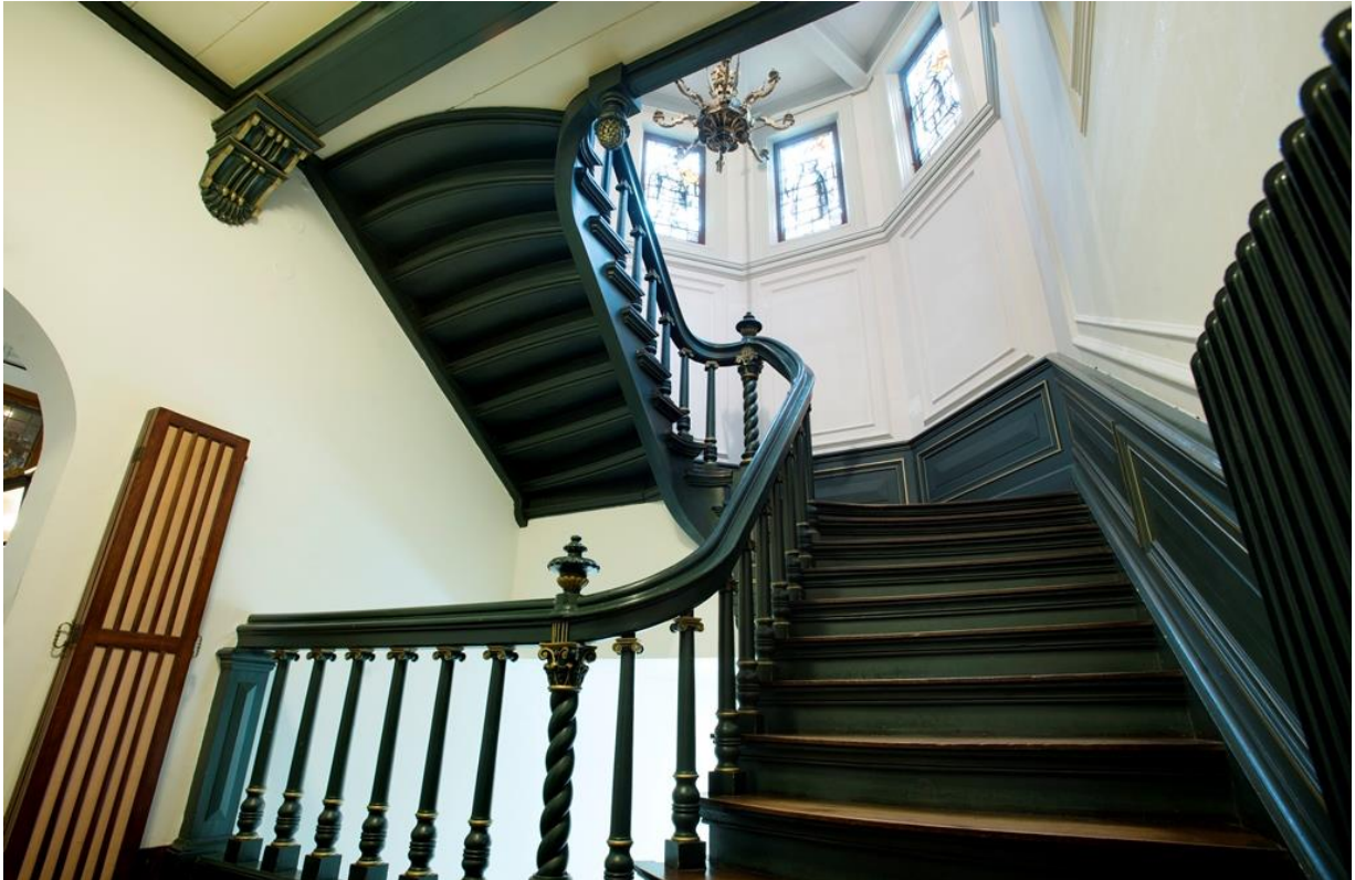
Huidige situatie Joristrap in Museum De Lakenhal.