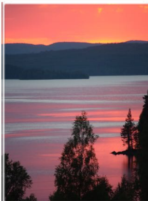
Mitandersfors tilbyr vakkert og rolig miljø i hjertet av Finnskogen.