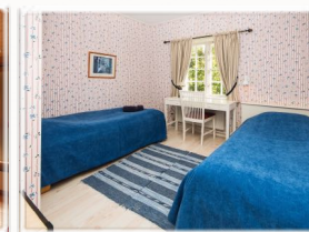
26 senger fordelt på 12 dobbeltrom og 2 enkeltrom - samtlige med egen dusj og toalett.