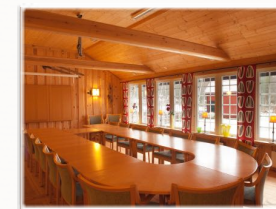
Konferanserom for opp til 30 personer. Prosjektor, whiteboard-tavle og papirtavle.