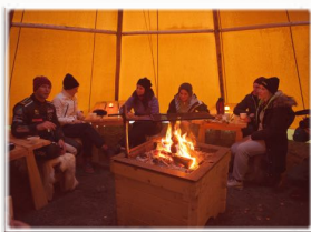
Mys runt öppna elden