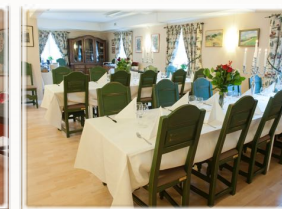
Matsalen har plats för upp till 30 personer.