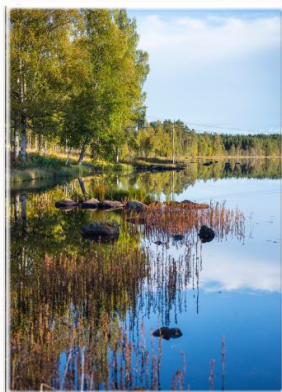
Mitandersfors erbjuder vacker och rogivande miljö i hjärtat av Finnskogen.