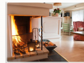
Värme vid den öppna spisen.

Buffélunch eller bordsservering, 3-rätters meny eller en festlig 7-rätters avsmakningsmeny. Julbord eller smörgåsbord. Köksmästaren har många fina menyer och dryckesförslag att välja mellan. Priser från 170,- till 1010,- per person exklusive dryck.