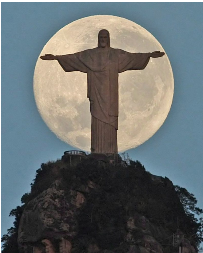
Cristo Redentor, 1931 (Rio de Janeiro, Brazil)

'Er zullen tekenen zijn aan de zon, de maan en de sterren, en op aarde zullen de volken in paniek raken, radeloos door het gebulder van de zee en de golven. De mensen zullen het besterven van schrik en spanning om wat de wereld gaat overkomen, want de hemelse machten zullen wankelen. Dan zullen ze de Mensenzoon met veel macht en heerlijkheid zien komen op een wolk. Als dat gaat gebeuren, sta dan op, recht en fier, want uw verlossing is dichtbij.'