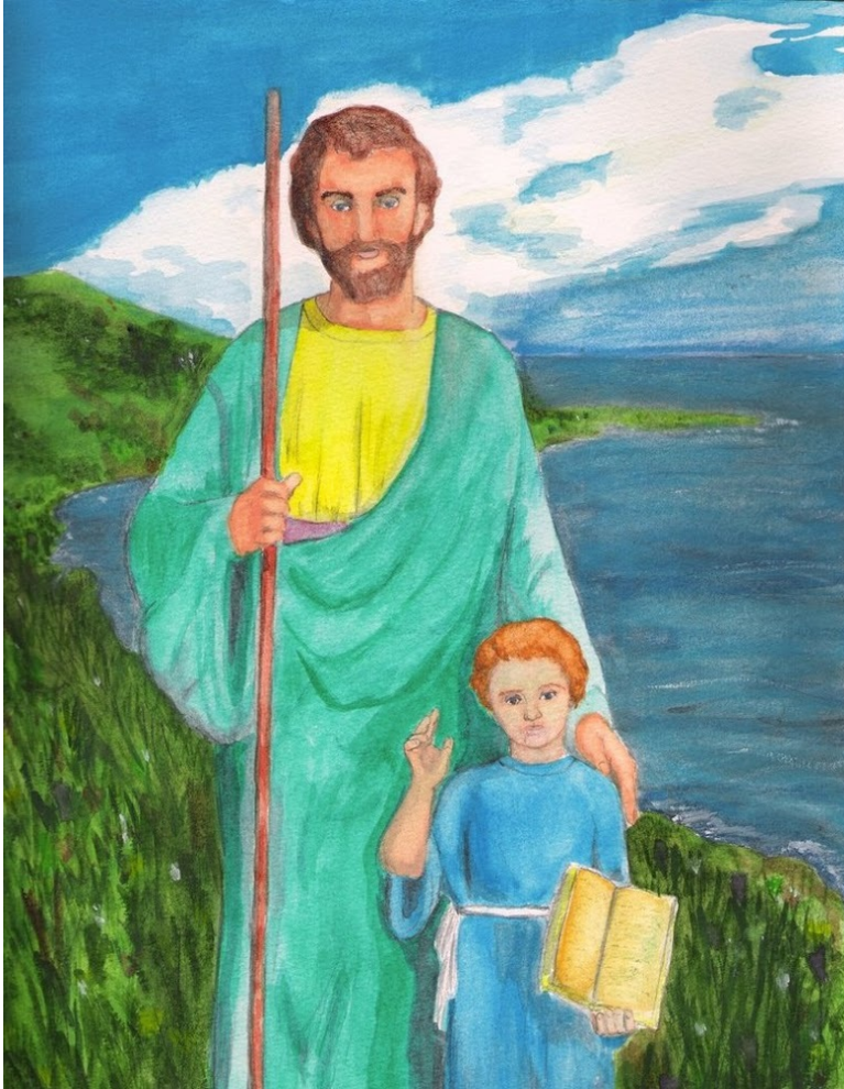
pinkvynilangel, St. Joseph + Jesus - ©pinkvynilangel

De jongen groeide op en werd steeds sterker, omdat Hij vervuld werd van wijsheid en door God rijkelijk werd begunstigd.