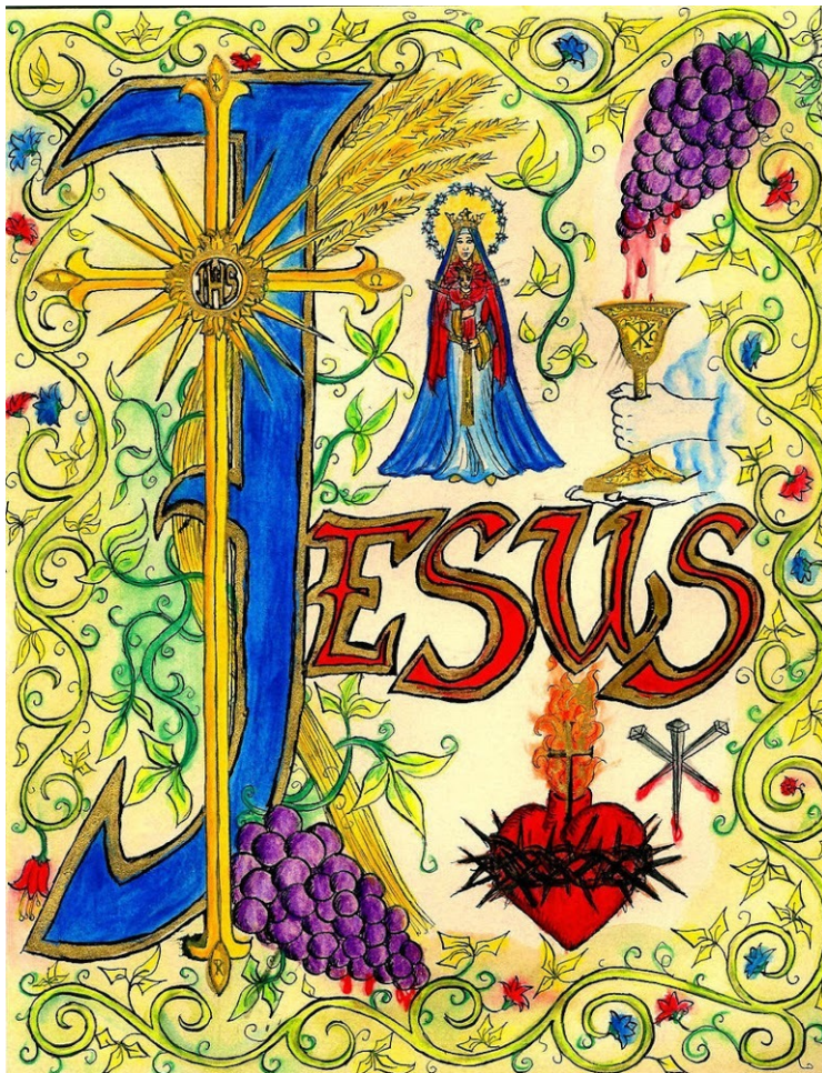
LordShadowblade, The Most Holy Name of Jesus, 2008 · ©LordShadowblade

Een week later, toen de tijd gekomen was dat Hij besneden moest worden, kreeg Hij de naam Jezus, die door de engel was genoemd voordat Hij in de moederschoot werd ontvangen.