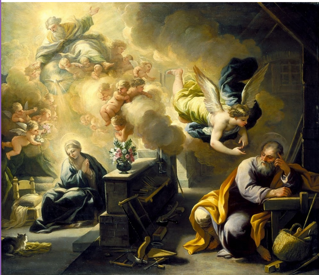
Georges de la Tour, The dream of St. Joseph, 1640 (Musée des Beaux-Arts, Nantes)

‘Jozef, zoon van David, wees niet bang uw vrouw Maria bij u te nemen, want wat bij haar tot leven is gewekt, is van de heilige Geest. Ze zal een zoon krijgen en u moet Hem de naam Jezus geven, want Hij is degene die zijn volk zal redden uit hun zonden.’