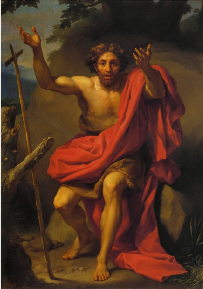
Anton Raphael Mengs, St. John the Baptist, 1780

Dit dan is het getuigenis van Johannes. De Joden hadden uit Jeruzalem priesters en Levieten op hem afgestuurd met de vraag: 'Wie bent u?' Onomwonden kwam hij ervoor uit: 'Ik ben de Messias niet.'