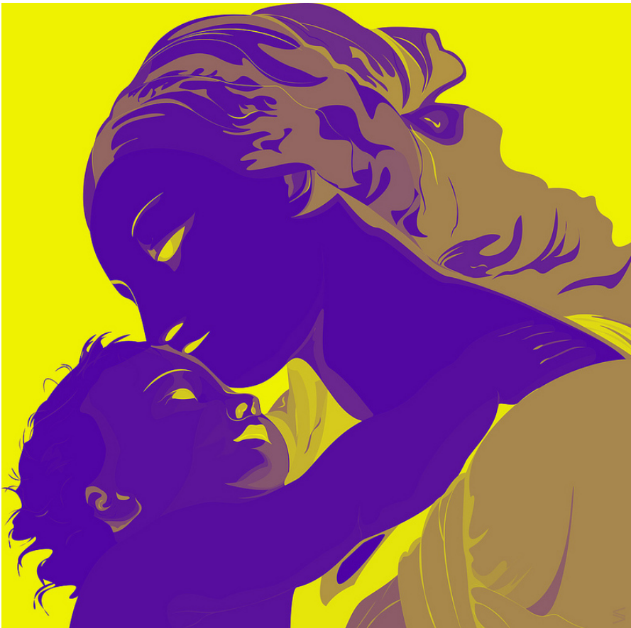
Vascotto V., Madonna and child, 2012 - ©Vascotto V.

Toen ze de wijk genomen hadden, verscheen aan Jozef in een droom een engel van de Heer, die zei: 'Sta op, neem het kind en zijn moeder mee en vlucht naar Egypte, en blijf daar tot ik u waarschuw. Want Herodes staat het kind naar het leven.' Hij stond op en nam nog die nacht met het kind en zijn moeder de wijk naar Egypte.