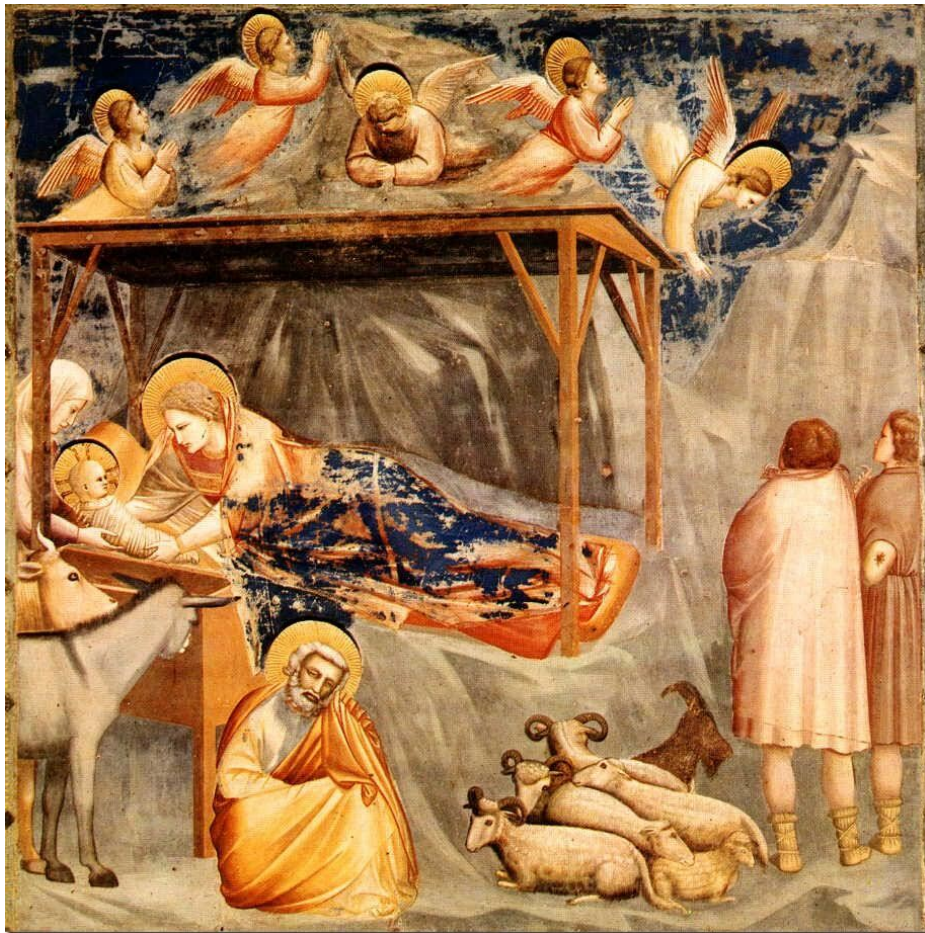
Giotto, Nativity, 1305 (Scrovegni Chapel)

Dan zal een twijg aan de stronk van Jesse ontspruiten, Een scheut uit zijn wortel ontkiemen. De geest van Jahweh zal op Hem rusten: De geest van wijsheid en verstand, De geest van raad en sterkte, De geest van kennis en godsvrucht.