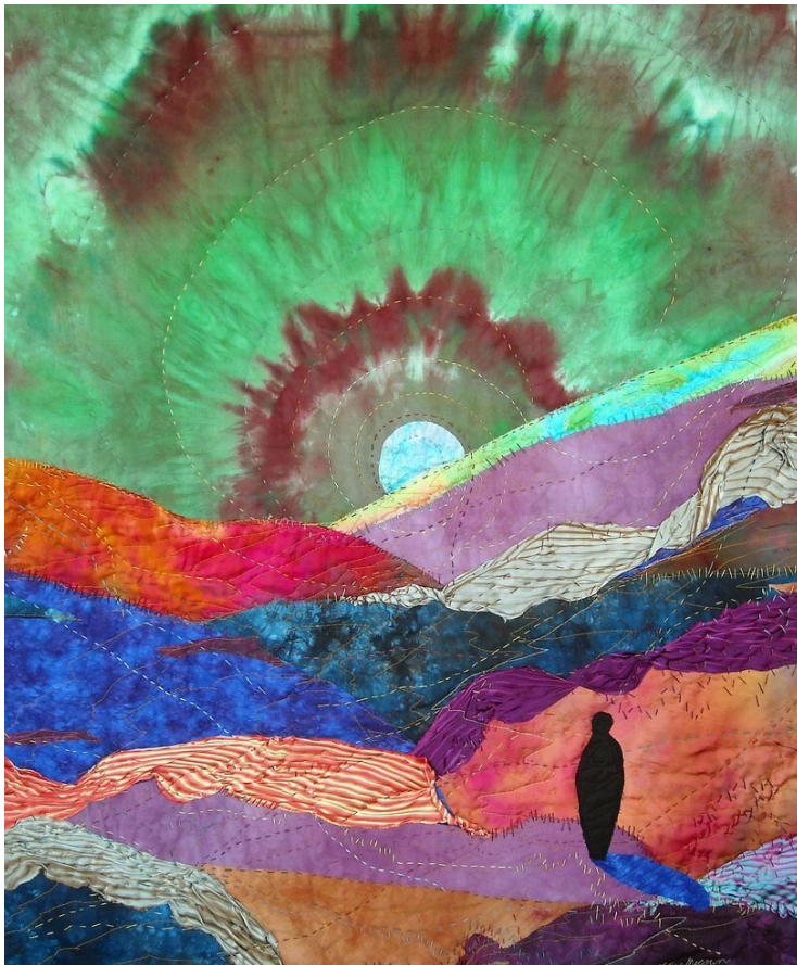
Lorie McCown, A voice in the wilderness, 2012 - ©Lorie McCown

zoals geschreven staat in het boek van de woorden van de profeet Jesaja: Een stem roept in de woestijn: Bereid de weg van de Heer, maak zijn paden recht; elk dal zal worden opgevuld, elke berg en heuvel geslecht; bochtige wegen worden recht, oneffen paden vlak; en alle mensen zullen de redding zien die van God komt.