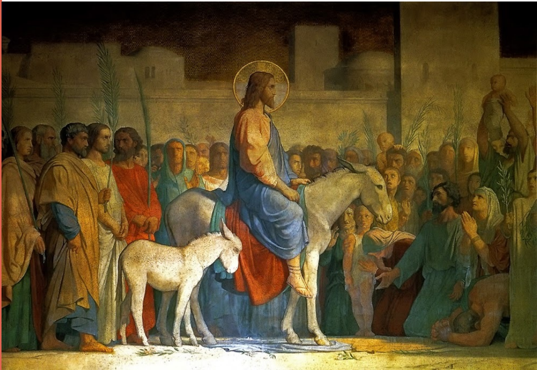
Hippolyte Flandrin, Christ's Entry into Jerusalem, 1842 (Church of Saint-Germain-des-Prés, Paris)

'Jeruzalem, Jeruzalem, dat de profeten doodt en diegenen stenigt die tot haar gezonden zijn! Hoe vaak heb Ik uw kinderen niet onder mijn hoede willen nemen, zoals een kip haar kuikens bijeenbrengt onder haar vleugels. Maar u hebt het niet gewild. Kijk, uw huis blijft onbewoond achter. Want Ik zeg u: vanaf nu zult u Me niet meer zien, tot het moment waarop u zegt: Gezegend is Hij die komt in de naam van de Heer.'