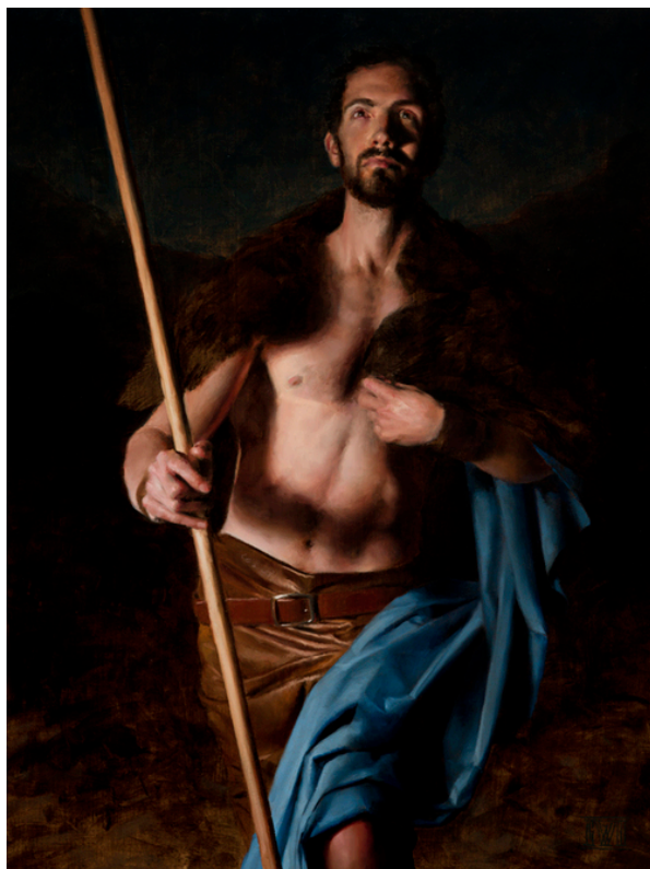
Ernest Vincent Wood III, John the Baptist in the Wilderness - ©Ernest Vincent Wood III

Toen ze waren heengegaan, begon Jesus tot de menigte over Johannes te spreken: Wat zijt gij in de woestijn gaan zien? Een riet, dat door de wind wordt bewogen? Neen; wat zijt gij gaan zien? Een mens, in zachte kleren gedost? Zie, die in zachte kleren gedost gaan, zijn in de paleizen der koningen. Waarom zijt ge dan uitgelopen? Om een profeet te zien? Ja, zeg Ik u, en meer dan een profeet. Hij is het, van wien geschreven staat: "Zie, Ik zend mijn gezant voor U uit, Die U de weg zal bereiden."