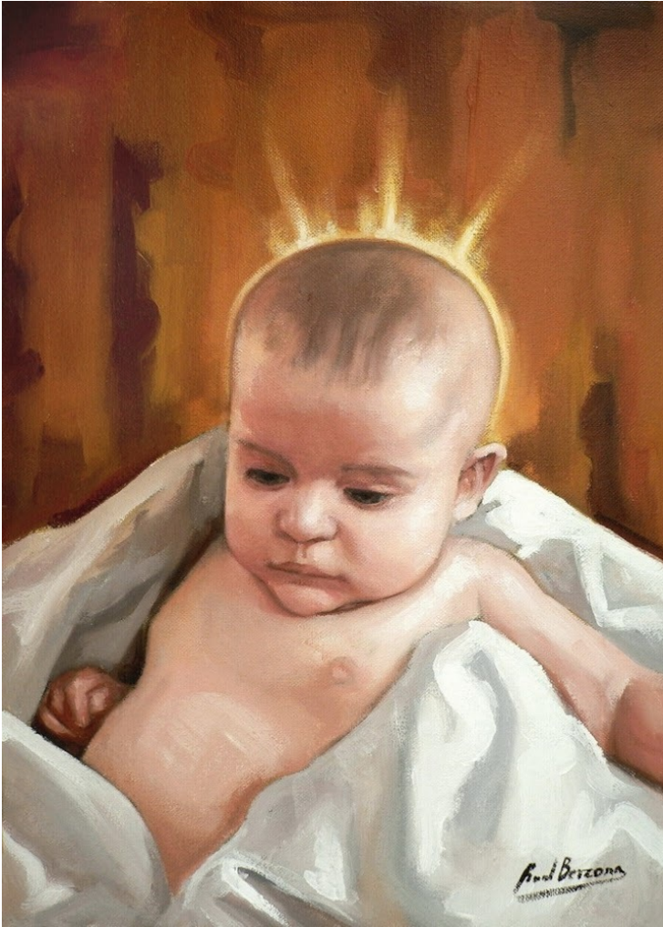
Raul Berzosa, Niño Jesús, 2007 - ©Raul Berzosa

In het begin was het woord, en het woord was bij God, en het woord was God.