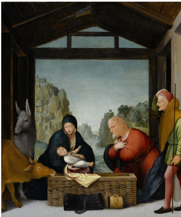
omgeving van Bartolommeo Suardi, De aanbidding der herders, 1500 - 1535 (Rijksmuseum, Amsterdam)

Toen de engelen weer van hen waren weggegaan naar de hemel, zeiden de herders tegen elkaar: 'Kom, we gaan naar Betlehem om te zien wat er is gebeurd en ons door de Heer is bekendgemaakt.' Haastig gingen ze erheen en vonden Maria en Jozef, en het kind dat in de voerbak lag.