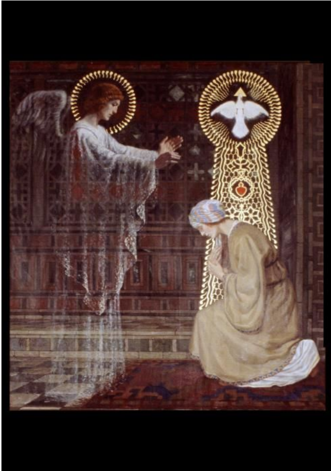
Annunciation (ORATORIO DELLA SS. TRINITÀ NEL PALAZZO VESCOVILE)

De engel antwoordde haar: 'Heilige Geest zal op u komen en kracht van de Allerhoogste zal u overdekken. Daarom zal het kind heilig genoemd worden, Zoon van God.'