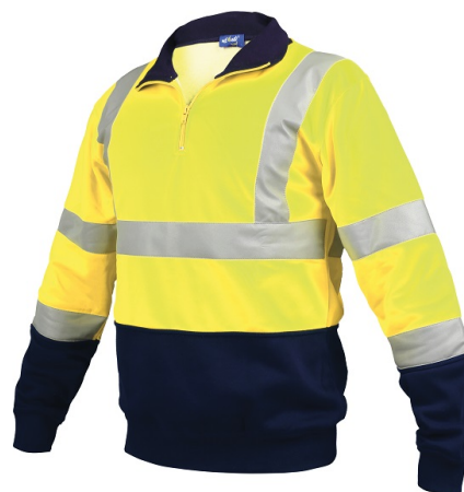
Sweat-shirt Haute Visibilité bicolore col montant zippé