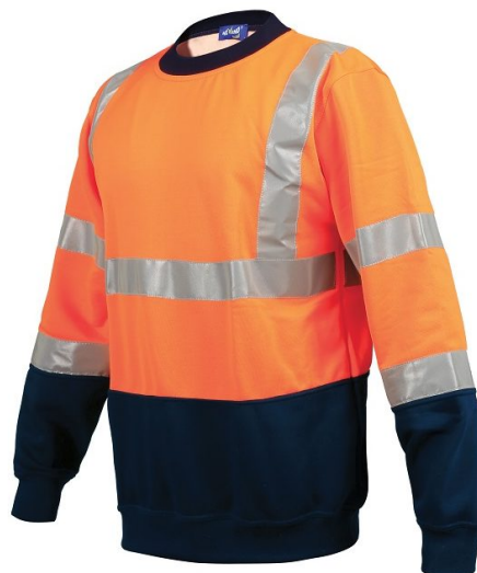
Sweat-shirt HV bicolore col rond