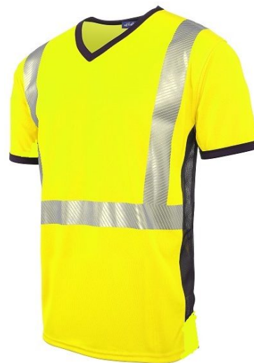
T-shirt manches courtes