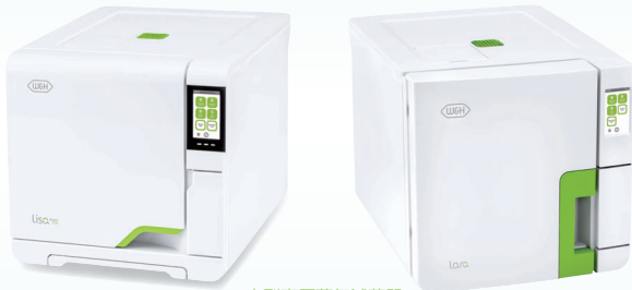
小型高圧蒸気滅菌器

必ず器具を乾燥させてから滅菌してください。お急ぎサイクル(リサのみ)は乾燥しません。