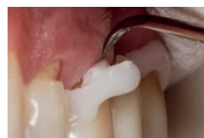
スケーラー等で素早く除去。