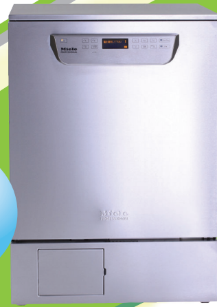
ミーレ ジェットウォッシャー