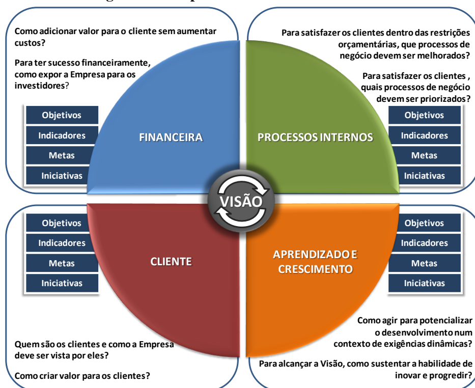
Figura 1 – Perspectivas do Balanced Scorecard

Fonte: Adaptado de KAPLAN & NORTON. A Estratégia em Ação, p.10. 1997.