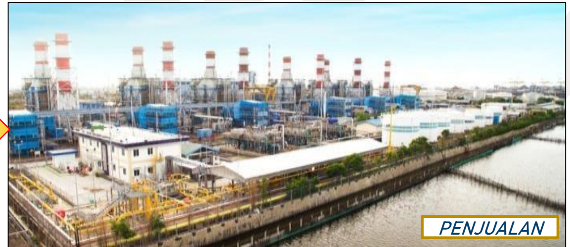
Penjualan ke PJB UP Gresik