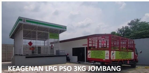
KEAGENAN LPG PSO 3KG JOMBANG