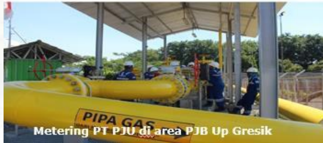
Metering PT PJU di area PJB Up Gresik