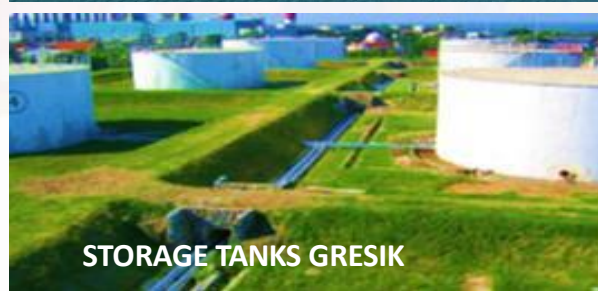
STORAGE TANKS GRESIK