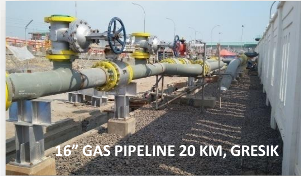
16" GAS PIPELINE 20 KM, GRESIK