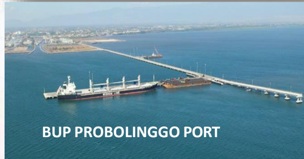
BUP PROBOLINGGO PORT