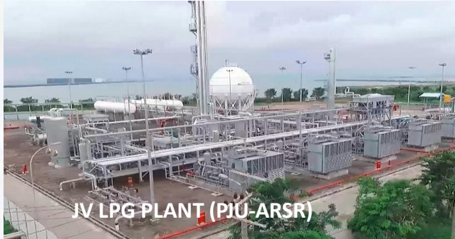
IV LPG PLANT (PIU-ARSR)