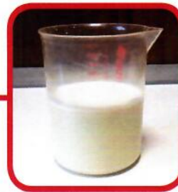
200 g + 1 l Wasser (40 °C)