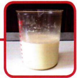
24 h Stabilität

PANTO® Pre ist ein sehr schmackhafter Prestarter, der durch ein gutes Verhältnis von Milchrohwaren und pflanzlichen Komponenten optimal für die frühe Verfütterung an Saugferkel, welche mit 3 Wochen abgesetzt werden, gedacht ist. Wisan®-Komponenten liefern leicht verfügbare Proteinträger und mittelkettige Fettsäuren. Durch zusätzliche Probiotika und einen speziellen Wirkstoffkomplex PLURATRACE® wird zusätzlich die Darmgesundheit gefördert.