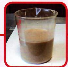
Nach 900 Sek. quellen + 5 Sek. anmischen