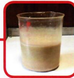
Nach dem Anmischen