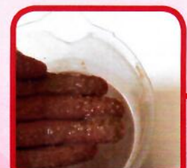
Konsistenz in der Anlage