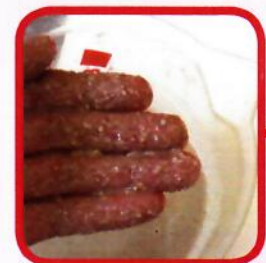
Konsistenz in der Anlage

PANTO® wean ist ein idealer Prestarter für Ferkel, welche mit 4 Wochen abgesetzt werden. Durch eine Auswahl an leicht verdaulichen Komponenten, das Spezialprodukt Wisan®-Lein und Probiotika, wird die Verdauung gefördert und die Ferkel werden optimal in ihrer Entwicklung unterstützt. PANTO® Wean verbindet eine gute Futteraufnahme mit hoher Sicherheit.