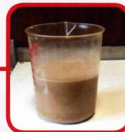
Nach dem Anmischen