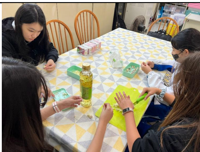
家長會與學務處同仁共同協助食農教育過程