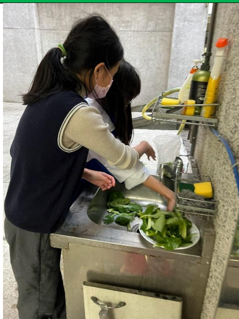
同學練習烹飪及切菜