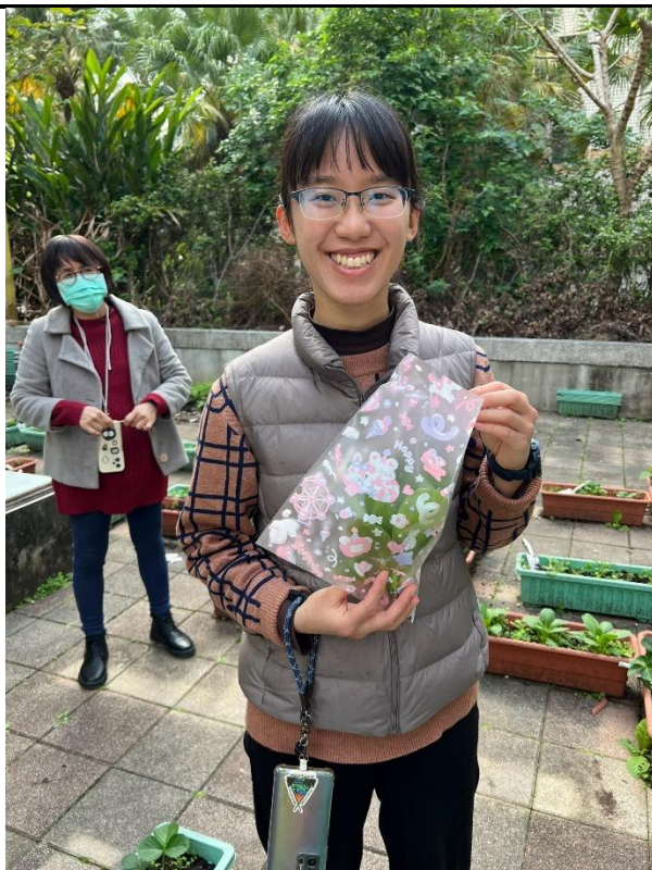
草莓種植雙語反思學習單