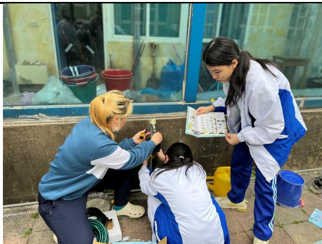
生活科技老師裝置濕度感應器