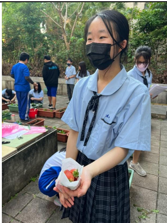
同學包裝作物送給師長