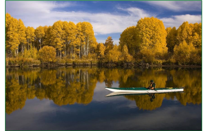
3) Muut maaseudun yritykset, kuten esim. pienteollisuus, palveluala, matkailu, asiantuntijayritykset, ohjelmisto- ja digialan toimijat jne