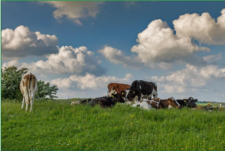
1) "Perinteiset" maatilat

Tervetulleita ovat kaikki maaseudulla toimivat yritykset