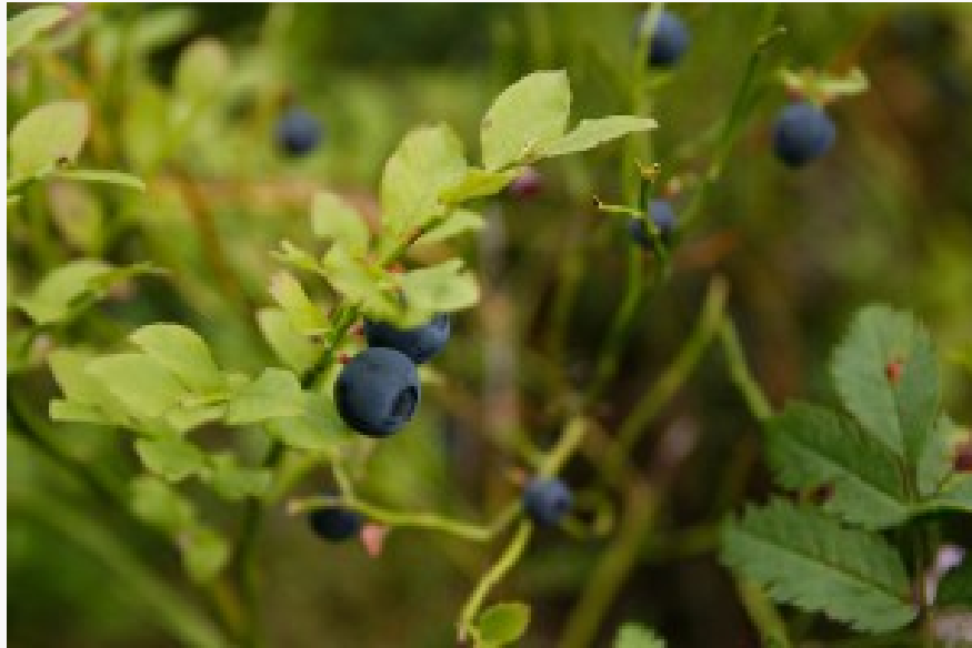
Luomumustikkaa kerättiin jo tänä syksynä.

Luomusertifiointi kattaa kaikki metsästä saatavat keruutuotteet, ei pelkästään syötäviä kasvinosia. Keruutapa ei kuitenkaan saa vahingoittaa alueen luonnonvaraista kasvistoa.