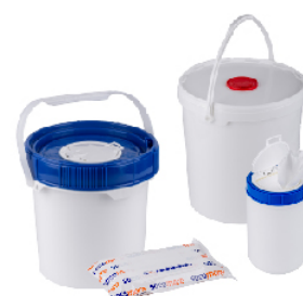
Different packaging available on demand