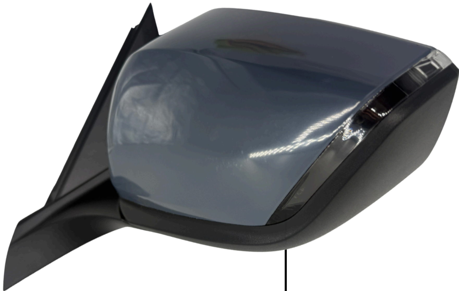
Kierunkowskaz Turn Signal Lamp