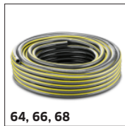
64, 66, 68