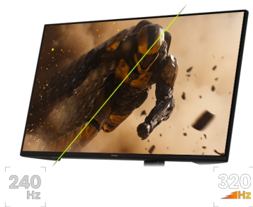
320Hz & 0.6ms MPRT

Dostępny także z matrycą IPS panel technology LED: ProLite XB2791HS-B1