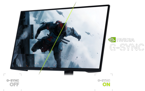
Zgodny z NVIDIA G-SYNC

Dzięki częstotliwości odświeżania 320Hz i czasowi reakcji 0.6ms MPRT moc jest zawsze z Tobą! Podejmuj decyzje w ułamku sekundy i bądź pewien, że obraz wyświetlany na ekranie jest zawsze płynny i wyraźny.