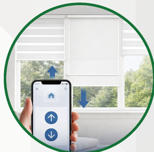
Sterowanie roletami (góra / dół)