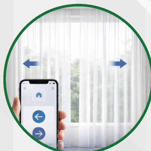
Sterowanie kurtynami i zasłonami