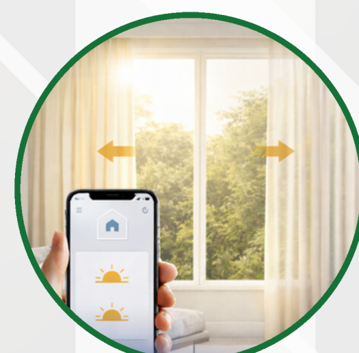
Automatyczne dopasowanie światła dziennego