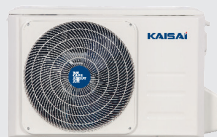
Jednostka zewnętrzna KRX