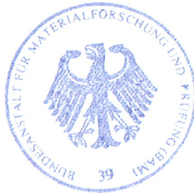
Dipl.- Ing. B.-U. Wienecke

Arbeitsgruppe Zulassung und Verwendung Im Auftrag / For