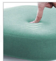
Pianka formowana wtryskowo

Anatomiczne siedzisko eliminuje uciski i zapewnia komfort przez cały dzień. Pianka wtryskowa i oddychająca tapicerka gwarantują trwałość i wygodę na lata.