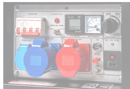
Proton 360 (seria Plus, seria Oasis)