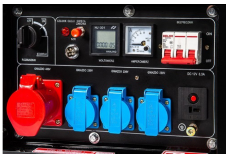
✔ Proton 3 (seria Plus, seria Oasis)