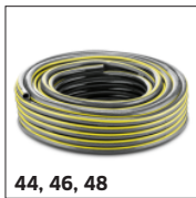
44, 46, 48