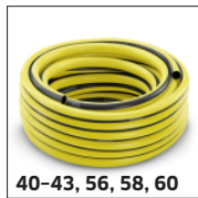
40-43, 56, 58, 60