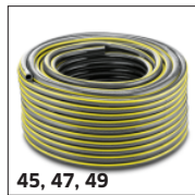
45, 47, 49