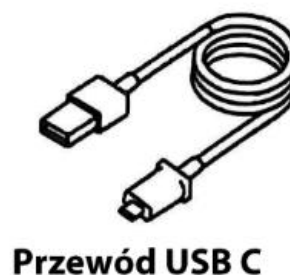
Przewód USB C