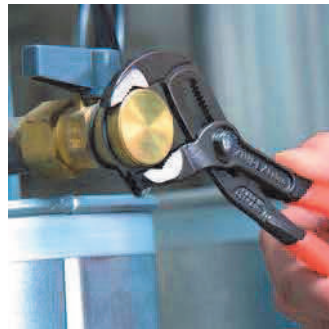
Szybka i pewna regulacja bezpośrednio na chwytanym przedmiocie