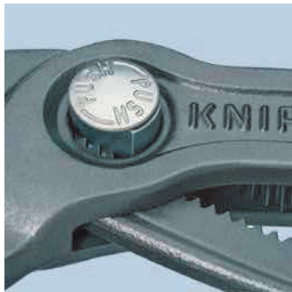
Precyzyjna regulacja za pomocą przycisku: szybko i wygodnie

Szczypce z uchwytem do mocowania zabezpieczenia przed upadkiem