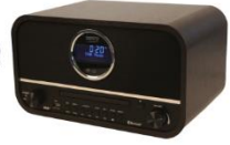
RETRO RADIO CR 1182