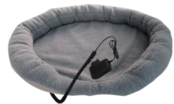
HEATED ANIMAL DEN CR 7431