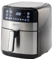
AIR FRYER OVEN CR 6311