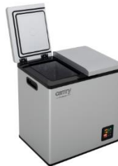
PORTABLE FRIDGE CR 8076