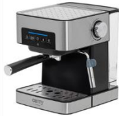
ESPRESSO MACHINE CR 4410