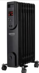
OIL FILLED RADIATOR CR 7812