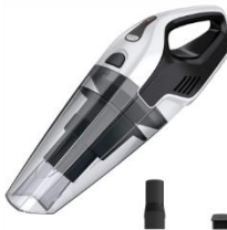
BAGLESS VACUUM CLEANER CR 7046