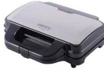
SANDWICH MAKER CR 3054