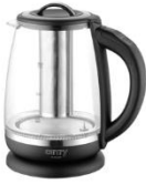
ELECTRIC KETTLE CR 1290