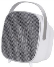
CERAMIC FAN HEATER CR 7732