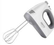
MIXER CR 4220