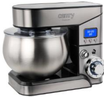
FOOD PROCESSOR CR 4223