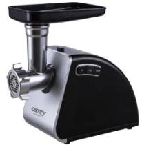
MEAT MINCER CR 4812