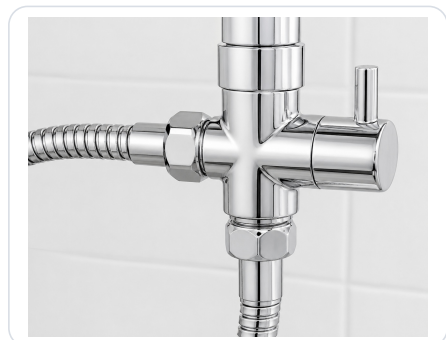
Zastosowanie w kolumnie