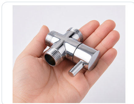
Produkt w dłoni