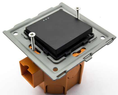
6 Podłączmy przewody elektryczne do modułu a następnie przykręcamy metalowa ramkę do puszki montażowej