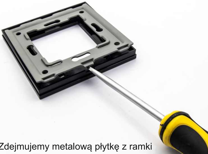
1 Zdejmujemy metalową płytkę z ramki