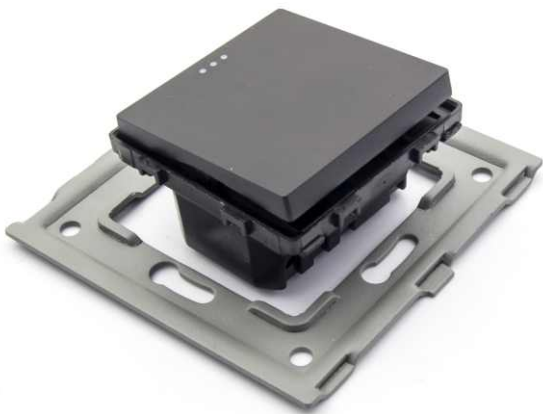
3 Poprawne ustawienie modułu względem metalowej ramki