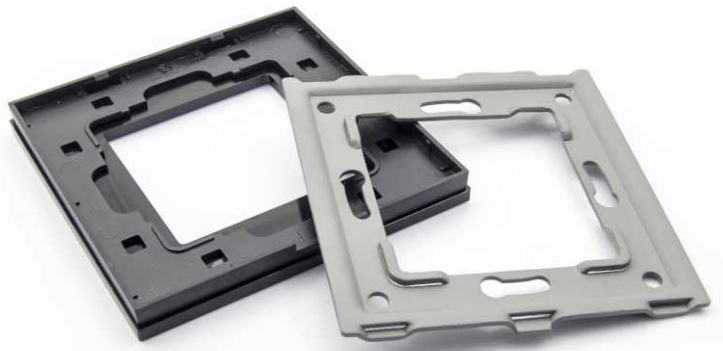
2 Elementy po zdjęciu metalowej ramki