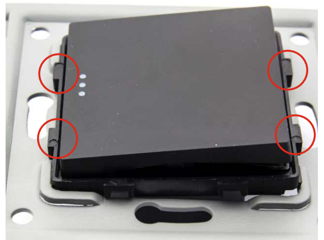
4 Zatrząskujemy moduł w metalowej ramce (cztery punkty)