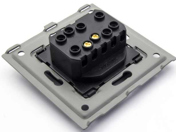
5 Poprawny montaż modułu z ramką