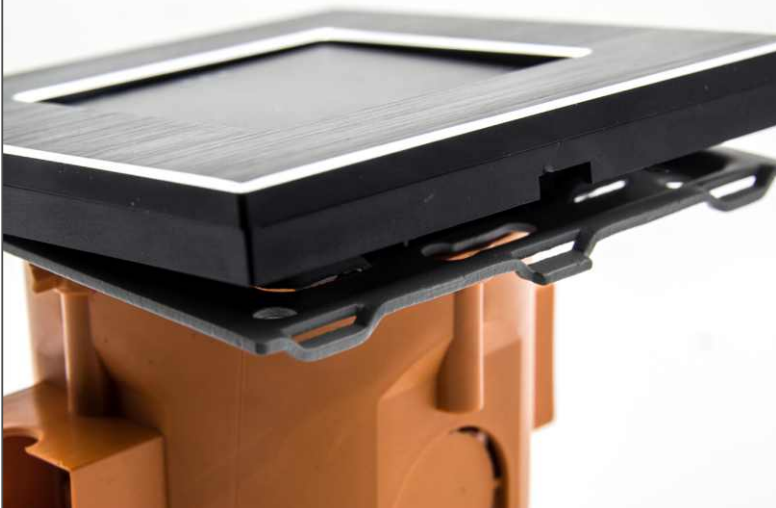
7 Łączymy elementy w jedną całość