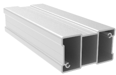
Profil aluminiowy 80x45 mm