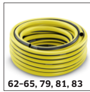
62-65, 79, 81, 83