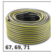
67, 69, 71