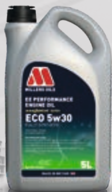
ECO 5w30 kod: 7706

MID SAPS, do silników benzynowych, Diesel oraz hybrydowych. Olej klasy performance wykorzystujący technologię NANODRIVE, do samochodów wymagających oleju o lepkości 5w30 i klasie C3, głównie grupy VAG (Volkswagen, Audi, Bentley, Lamborghini, Seat, Skoda i Porsche), ale także BMW i Mercedes.