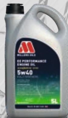
5w40 kod: 8208

MID SAPS, do silników benzynowych, Diesel oraz hybrydowych. Olej klasy performance wykorzystujący technologię NANODRIVE, do samochodów wymagających oleju o lepkości 5w40 i klasie C3, głównie grupy VAG (Volkswagen, Audi, Bentley, Lamborghini, Seat, Skoda i Porsche), ale także BMW i Mercedes.