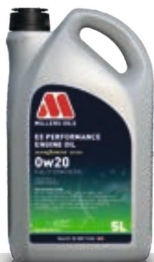
0w20 kod: 8206

Do silników benzynowych oraz hybrydowych. Olej klasy performance wykorzystujący technologię NANODRIVE, do samochodów wymagających oleju o lepkości 0w20, do wielu silników europejskich i azjatyckich.