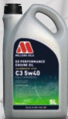
C3 5w40 kod: 7806

FULL SAPS, do silników benzynowych, Diesel oraz hybrydowych. Olej klasy performance wykorzystujący technologię NANODRIVE, do samochodów wymagających oleju o lepkości 5w30 i klasie A5/B5, głównie Ford, Jaguar Land Rover, oraz wielu producentów azjatyckich.