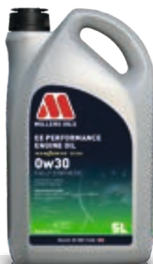
0w30 kod: 8207

Do silników benzynowych oraz hybrydowych. Olej klasy performance wykorzystujący technologię NANODRIVE, do samochodów wymagających oleju o lepkości 0w20, do wielu silników europejskich i azjatyckich.