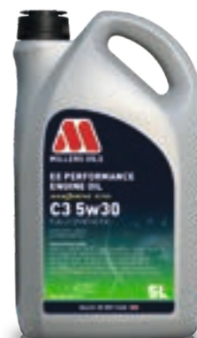
C3 5w30 kod: 7877

FULL SAPS, do silników benzynowych, Diesel oraz hybrydowych. Olej klasy performance wykorzystujący technologię NANODRIVE, do samochodów wymagających oleju o lepkości 0w30 i klasie A5/B5, głównie Volvo, oraz wielu silników europejskich i azjatyckich.