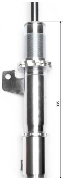
Fahrwerk Achse 1