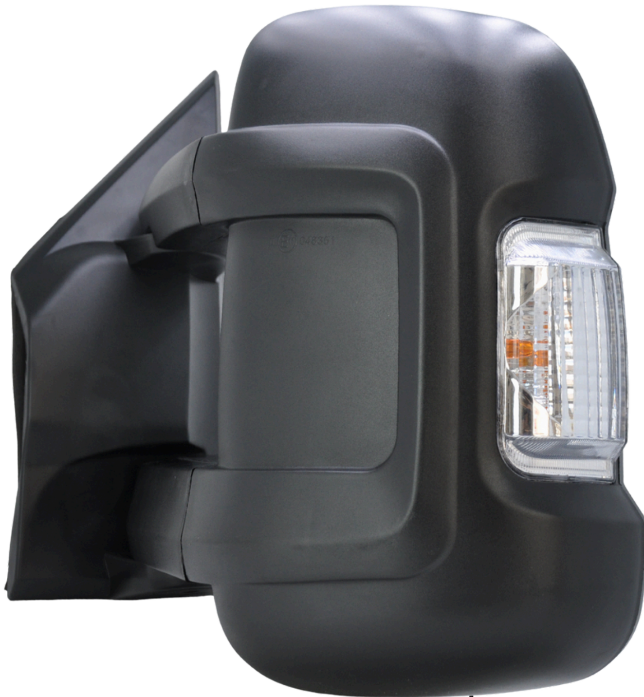
↓ Kierunkowskaz Turn Signal Lamp