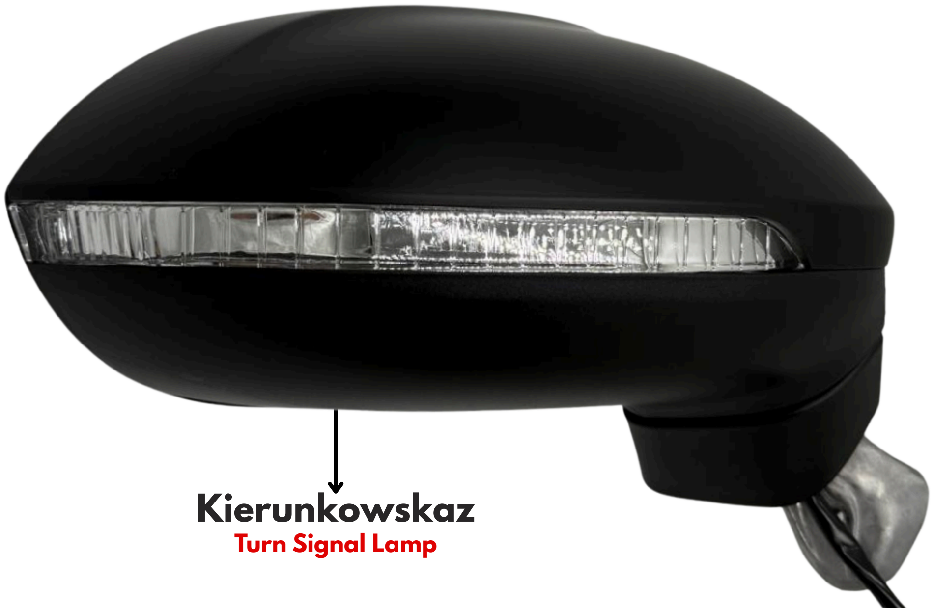
Kierunkowskaz Turn Signal Lamp