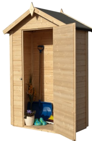
Zdjęcie przedstawia budynek niemalowany

Stale poprawiamy jakość naszych produktów, dlatego czasami komponenty mogą różnić się nieznacznie od tych przedstawionych i są poprawne tylko w momencie druku. Zastrzegamy sobie prawo do zmiany specyfikacji naszych produktów bez wcześniejszego powiadomienia. Podane wymiary są orientacyjne.