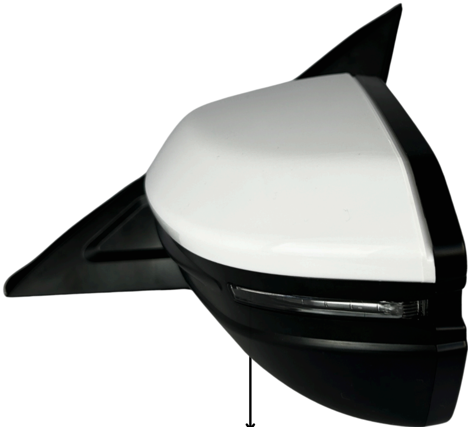
Kierunkowskaz Turn Signal Lamp