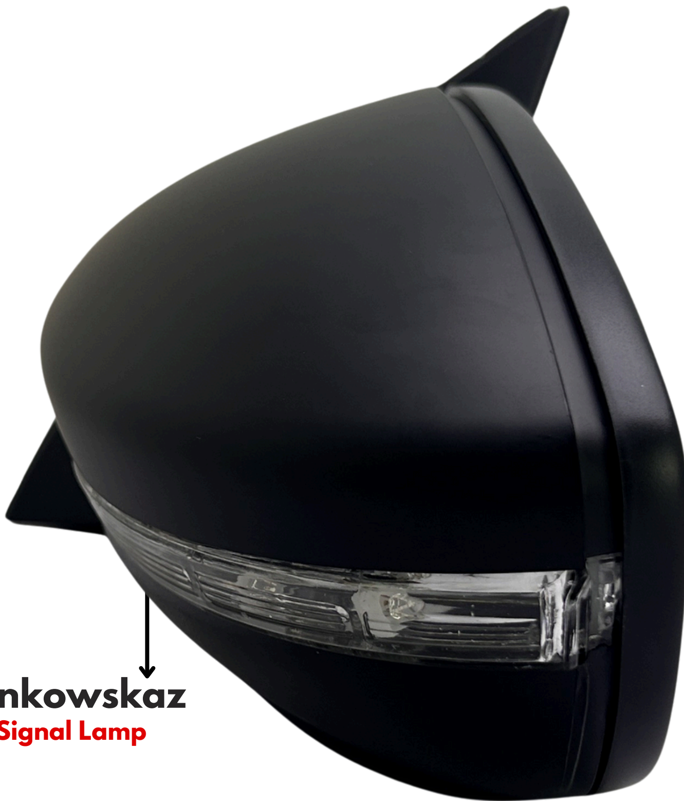
Kierunkowskaz Turn Signal Lamp