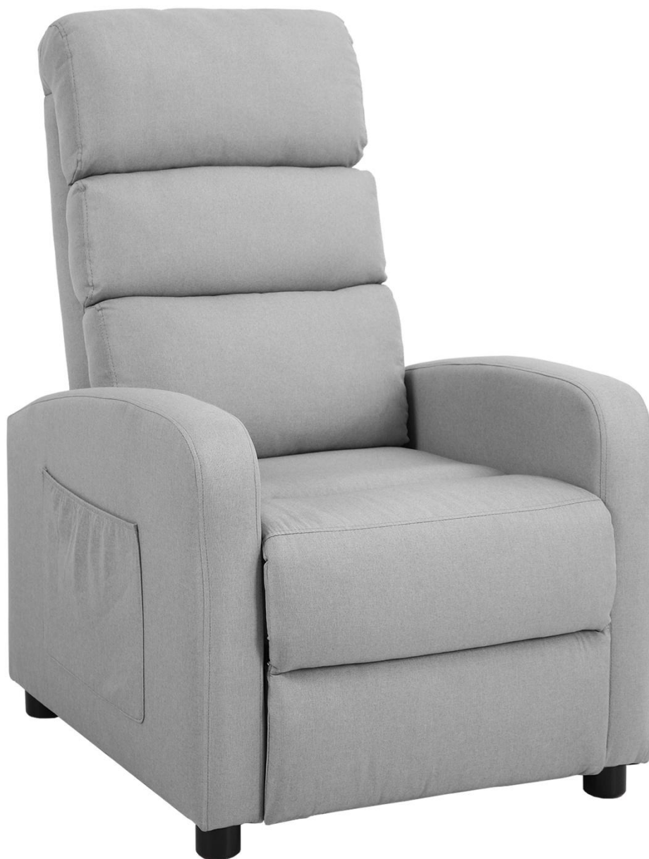
Fotel CHILI 2 POLI j. szary