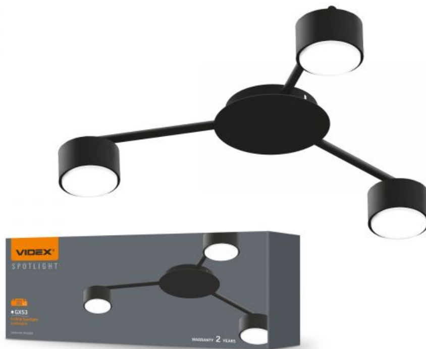
Oprawa sufitowa punktowa