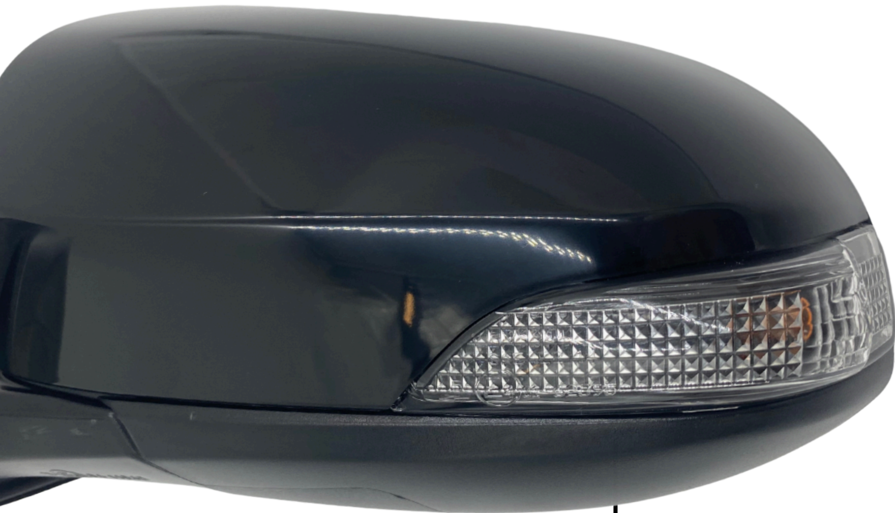
↓ Kierunkowskaz Turn Signal Lamp