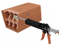
Wypełnij tuleję żywicą