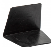
Fixation de pied de poteau sur béton