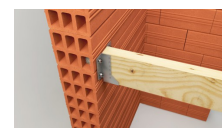
Fixation de sabot sur brique