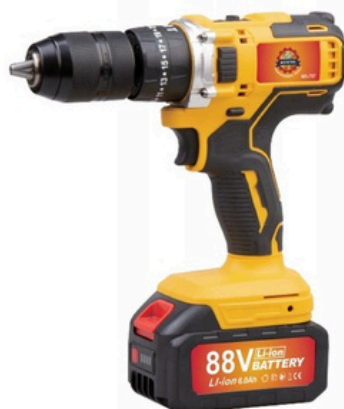
WIERTARKA AKUMULATOROWA BEZPRZEWODOWA