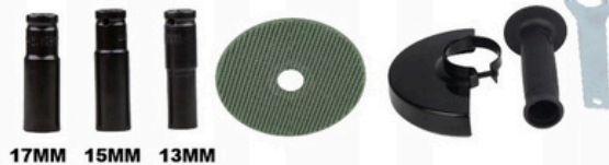
17MM 15MM 13MM