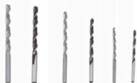
▶ Wiertło x 6 szt 2,5,3,4,5,6,8